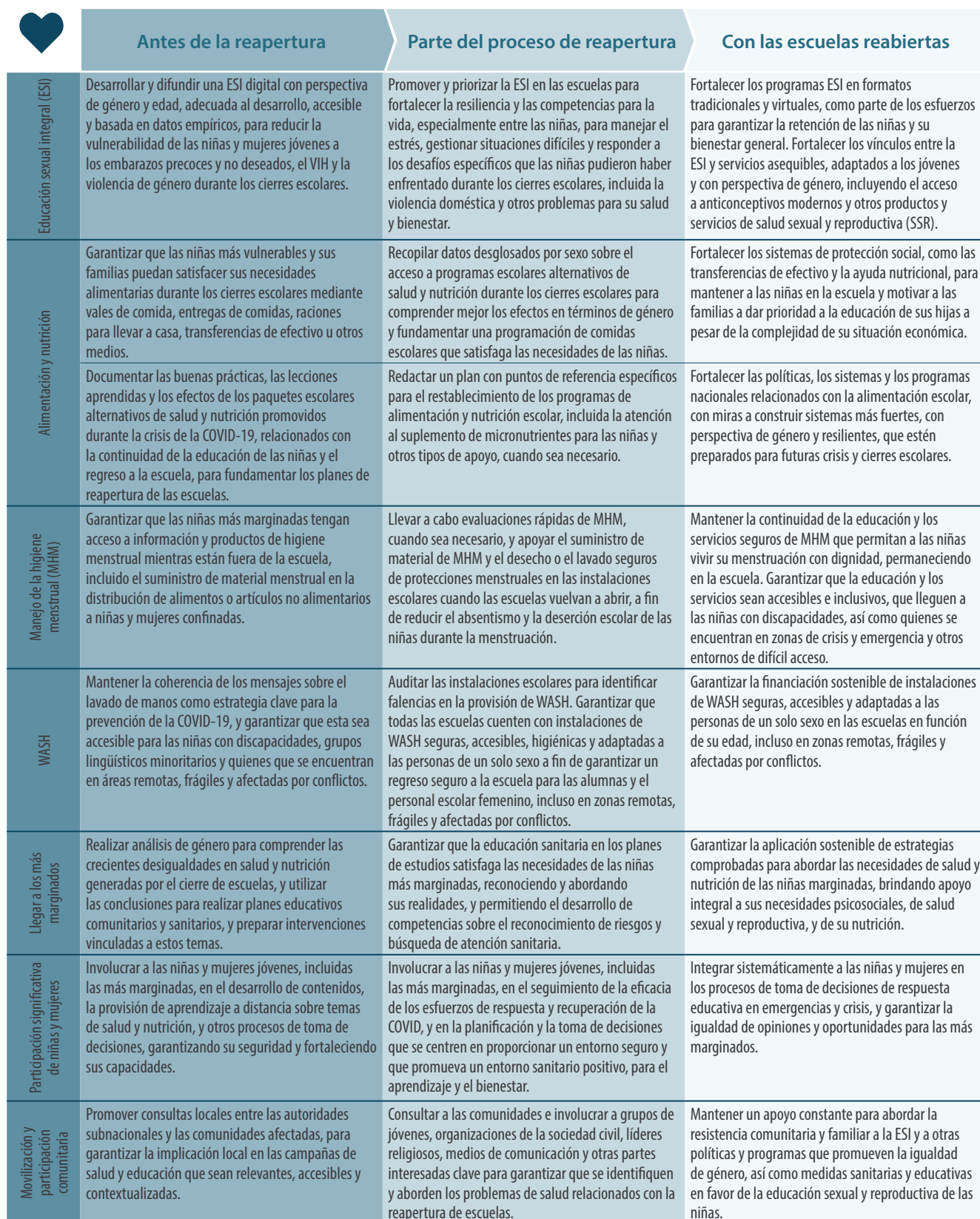
Tabla 2. Acciones recomendadas para promover la salud, la nutrición y el WASH